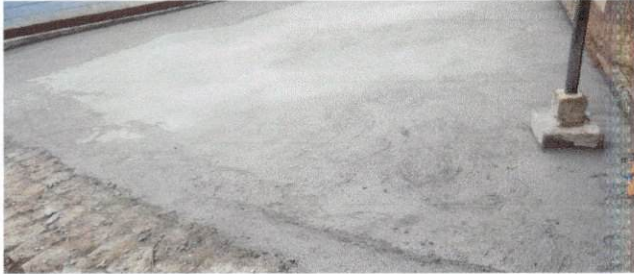
Foto1: Mejoramiento losa de Patio