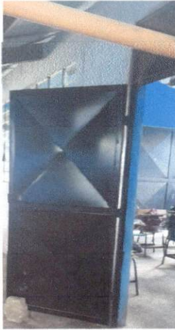
Foto1: Reparación de Puertas